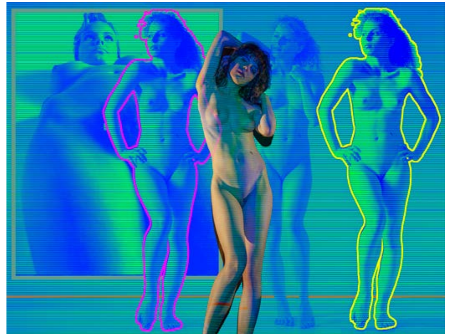
Big Nude I , druk transferowy, 150 x 197, 2016