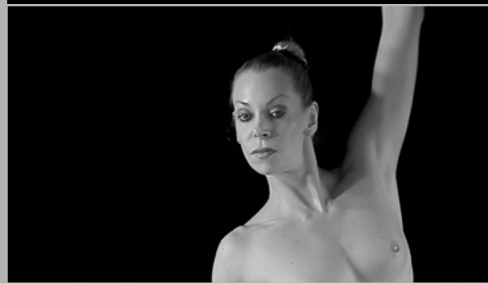
Kadry z filmu W grocie króla gór 9' 20" 2022