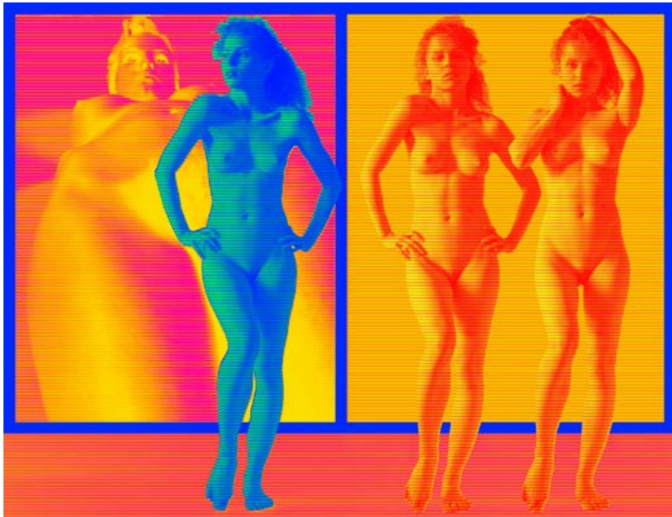
Big Nude II , druk transferowy, 150 x 195, 2017