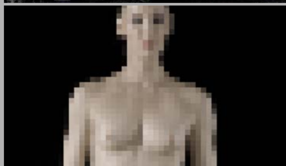
Kadry z filmu W grocie króla gór 9' 20'' 2022