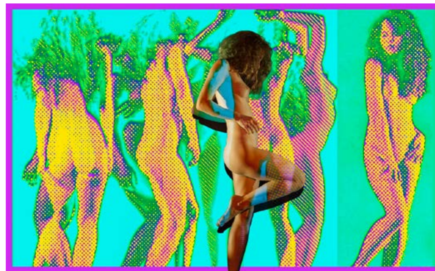
Sen Kariny VI , druk transferowy, 150 x 241, 2017 19