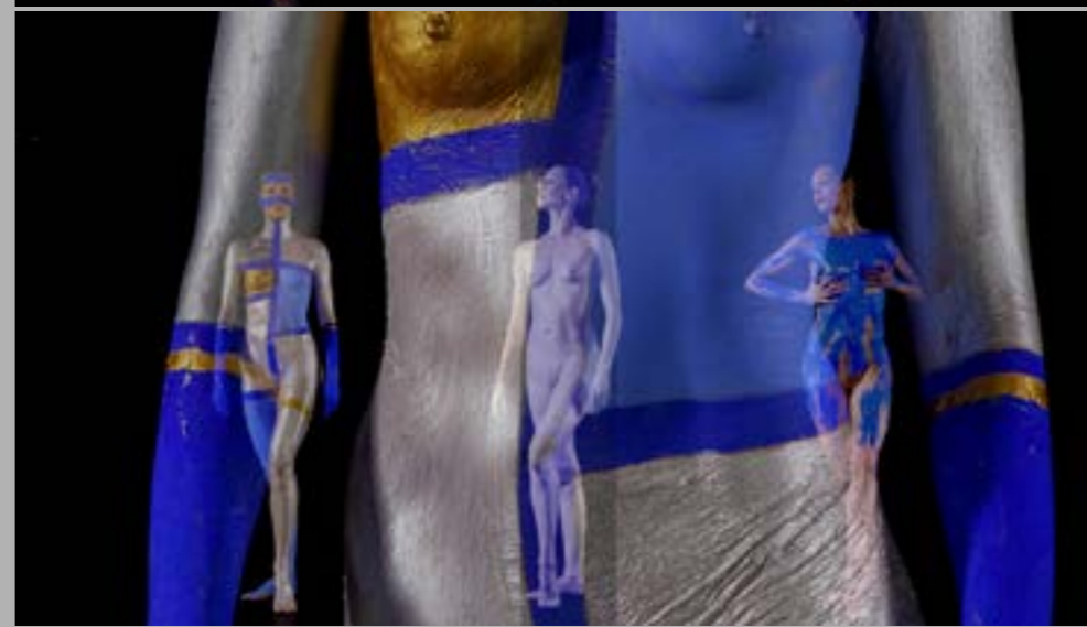
Kadry z filmu W grocie króla gór 9' 20" 2022