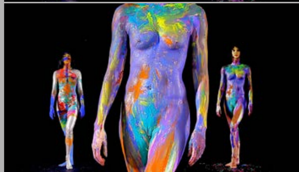
Kadry z filmu W grocie króla gór 9' 20" 2022