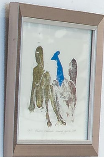
Arek Wesołowski KONTRASTY drzeworyt japoński 2018

drzeworyt japoński, 30 x 21 cm wewnątrz (z oprawą 50 x 40 cm), 2018